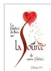
réf. : La fidélité de Dieu